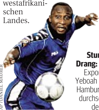
Sturm und Drang: Ghanas Exportartikel Yeboah hatte in Hamburg meist durchschlagenden Erfolg

Müsste man den „Mr. Ghana“ benennen, wäre die Antwort schnell gegeben: Kofi Annan ist wohl der berühmteste und wichtigste Sohn des westafrikanischen Landes.